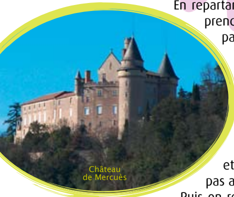
Château de Mercuès

Puis on retrouve les bords du Lot, avec pleins d'aires de jeux, et vous voilà revenu au départ. Il n'y a plus qu'à poser le vélo et continuer de s'amuser !