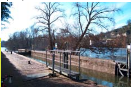
Écluse de Mercuès